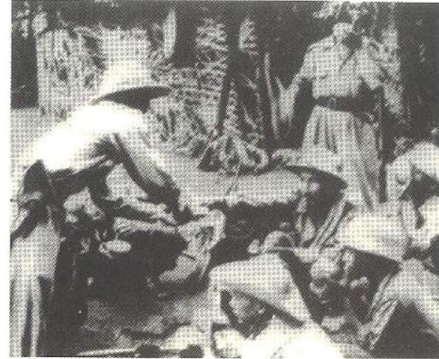
Chủ tịch Hồ Chí Minh nghỉ chân trên đường ra trận trong Chiến dịch Biên giới, năm 1950