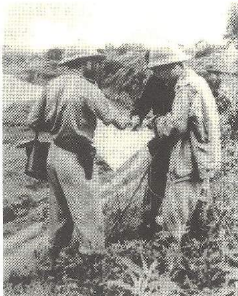
Chủ tịch Hồ Chí Minh xem bản đồ tác chiến, năm 1950