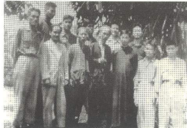
Chủ tịch Hồ Chí Minh chụp ảnh với Đoàn đại biểu nhân dân Việt Nam do Trưởng đoàn Hoàng Quốc Việt dẫn đầu trước khi lên đường thăm nước CHDCND Triều Tiên, ngày 30/6/1951