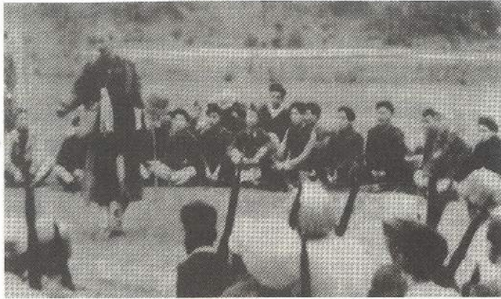
Chủ tịch Hồ Chí Minh thăm đơn vị bộ đội địa phương Cao Bằng, năm 1950