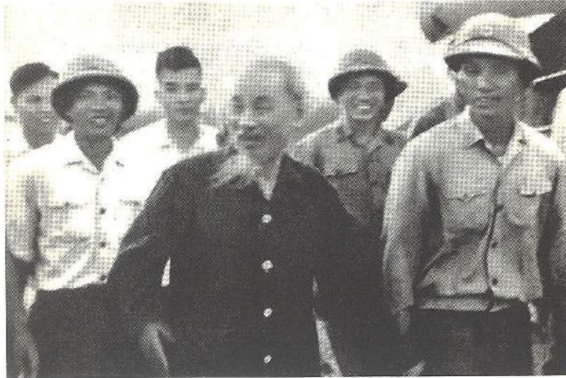
Bộ đội tên lửa đón Chủ tịch Hồ Chí Minh đến thăm ngay trên trận địa, năm 1965

A i là dân Việt Nam khỏe mạnh, muốn đánh Tây - Nhật, không sợ khó nhọc, nguy hiểm đều có thể thành một đội viên du kích. Nên chú ý những người nhanh nhẹn, dũng cảm có kinh nghiệm đánh giặc chút ít, nhất là những người đã đi lính.