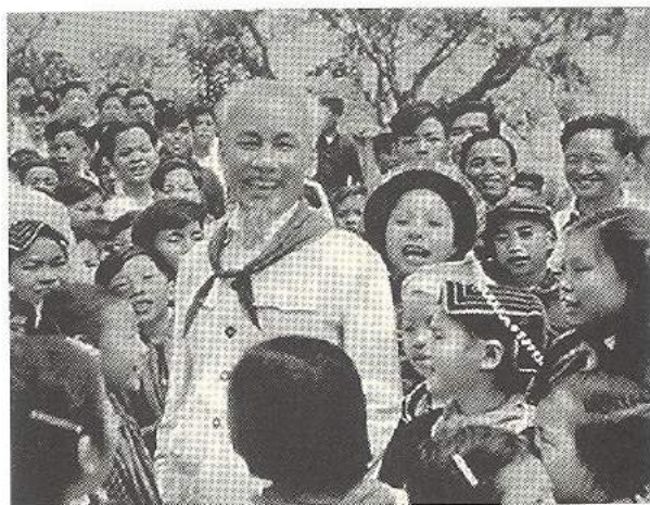
Chủ tịch Hồ Chí Minh với thiếu nhi các dân tộc Việt Bắc, năm 1960