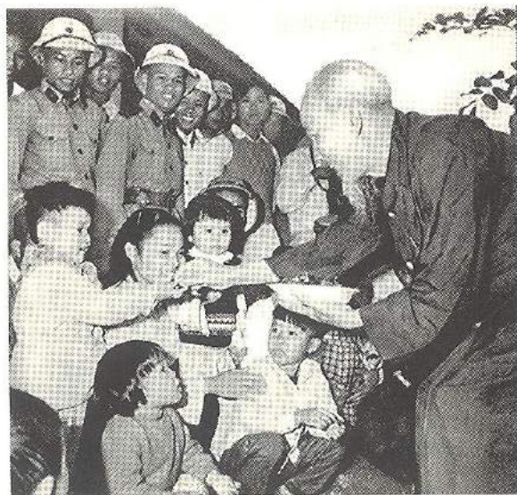
Chủ tịch Hồ Chí Minh chia kẹo cho thiếu nhi Thanh Hóa, ngày 10/12/1961