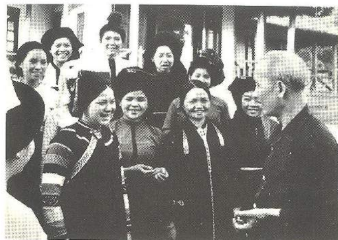
Chủ tịch Hồ Chí Minh với đoàn đại biểu phụ nữ dân tộc Tây Bắc, năm 1959