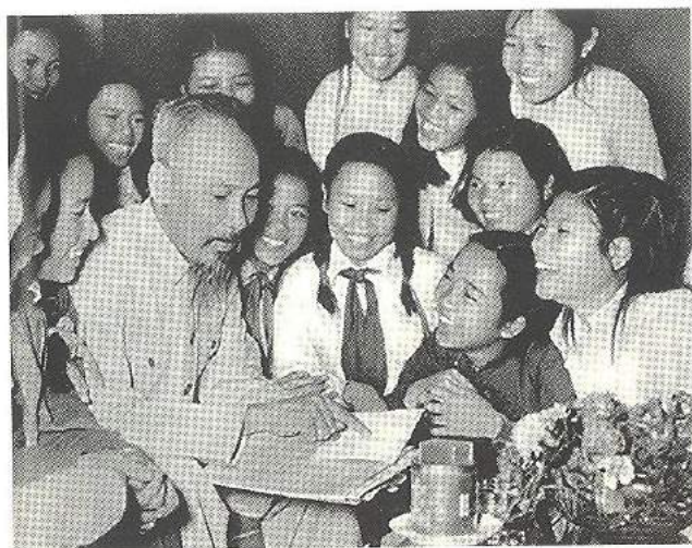
Học sinh Trường nữ Trưng Vương Hà Nội mừng sinh nhật Bác tại đại hội học sinh của Trường, tháng 5/1956