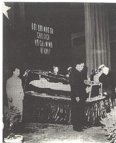
Các đồng chí Tôn Đức Thắng, Lê Duẩn, Trường Chinh, Phạm Văn Đồng túc trực bên linh cữu Chủ tịch Hồ Chí Minh