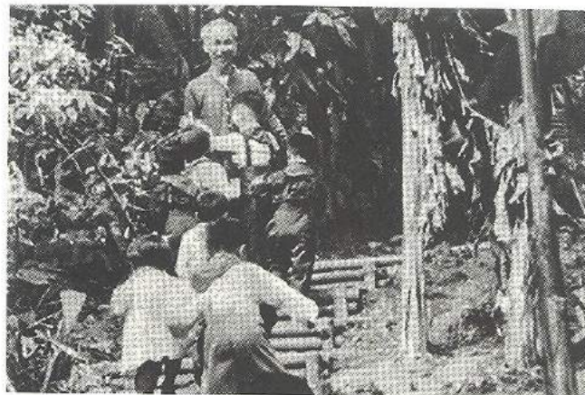
Chủ tịch Hồ Chí Minh đón các cháu thiếu nhi ở chiến khu Việt Bắc, năm 1951