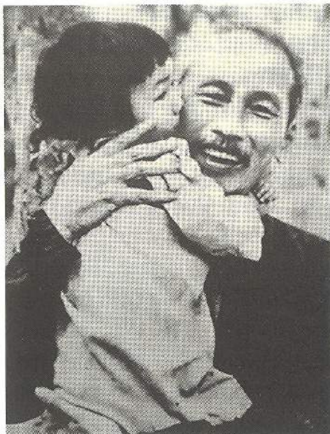
Chủ tịch Hồ Chí Minh với cháu bé, Việt Bắc, năm 1950