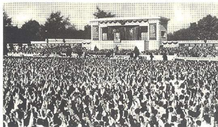
Đồng bào tiến đưa Chủ tịch Hồ Chí Minh đến nơi yên nghỉ cuối cùng, tháng 9/1969