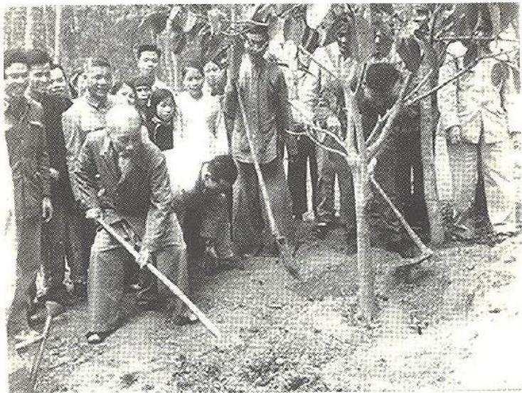
Chủ tịch Hồ Chí Minh tham gia Tết trồng cây với bà con Bát Bạt, Hà Tây, năm 1969