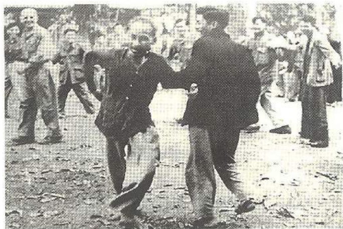
Chủ tịch Hồ Chí Minh tham gia đêm liên hoan Việt Bắc, năm 1951