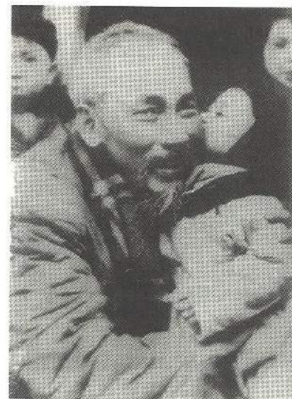
Thiếu nhi Việt Bắc vui với Chủ tịch Hồ Chí Minh, ngày 01/6/1953