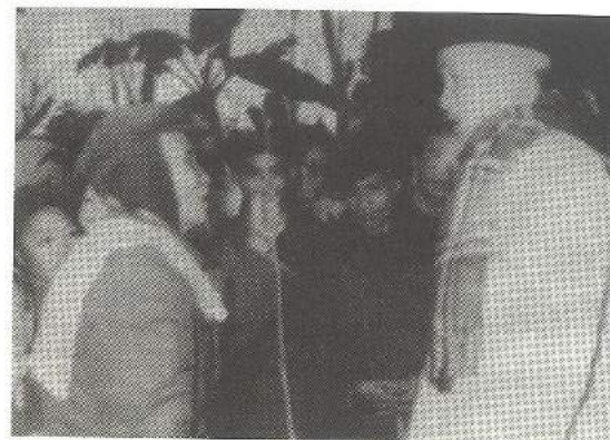
Chủ tịch Hồ Chí Minh thăm bà con nông dân Hợp tác xã Thắng Lợi, Phú Thọ, ngày 28/01/1964