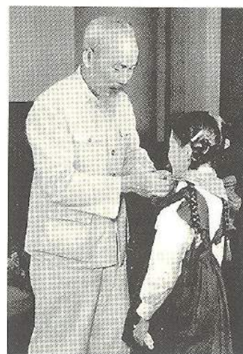
Chủ tịch Hồ Chí Minh quàng khăn đỏ cho đại biểu thiếu nhi Hà Nội đến chúc mừng Người nhân 30 năm thành lập Đảng, tháng 01/1960