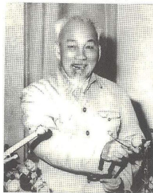
Chủ tịch Hồ Chí Minh đọc thư chúc Tết năm 1968