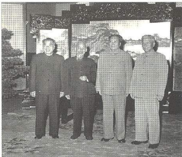
Chủ tịch Hồ Chí Minh, Chủ tịch Đảng Cộng sản Trung Quốc Mao Trạch Đông, Chủ tịch nước Lưu Thiểu Kỳ, Tổng Tư lệnh Chu Đức chụp ảnh nhân dịp Người sang dự lễ kỷ niệm 10 năm Quốc khánh Trung Quốc vào cuối tháng 9/1959