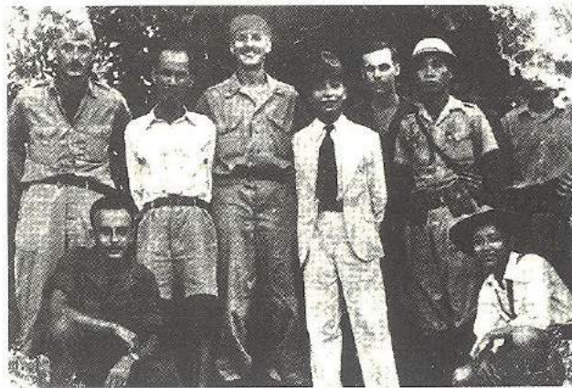
Chủ tịch Hồ Chí Minh và đồng chí Võ Nguyên Giáp chụp ảnh cùng biệt đội Con Nai (1) thuộc lực lượng Đồng minh tại Tuyên Quang, tháng 8/1945