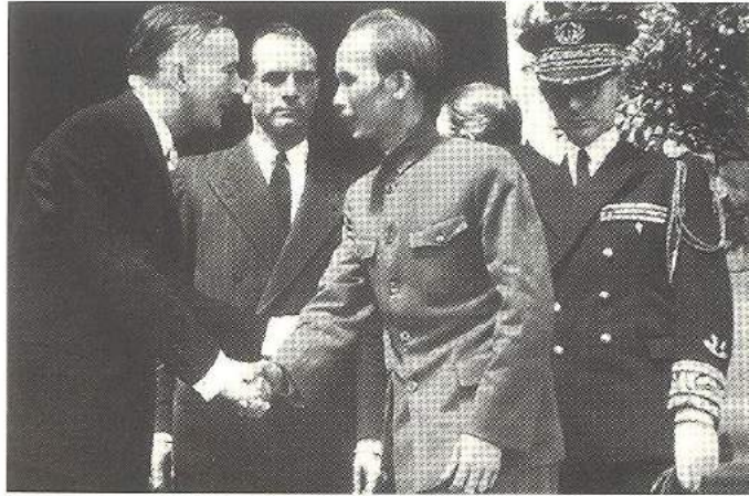
Thủ tướng Pháp Georges Bidault tiễn Chủ tịch Hồ Chí Minh ra cửa dinh Thủ tướng sau bữa tiệc chiêu đãi Người trong chuyến thăm Cộng hòa Pháp, ngày 02/7/1946