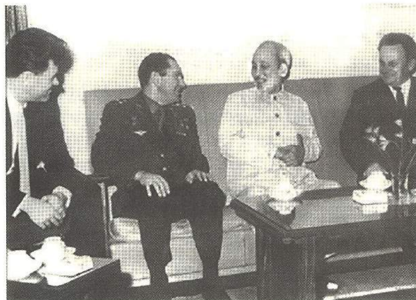
Chủ tịch Hồ Chí Minh tiếp Anh hùng phi công vũ trụ G.S Titov, Trưởng đoàn đại biểu Hội Hữu nghị Xô - Việt sang thăm Việt Nam, ngày 11/11/1966