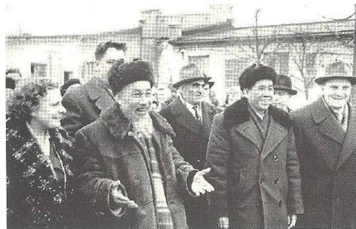
Chủ tịch Hồ Chí Minh và Bí thư thứ nhất Lê Duẩn dự Đại hội lần thứ XXII của Đảng Cộng sản Liên Xô, năm 1961