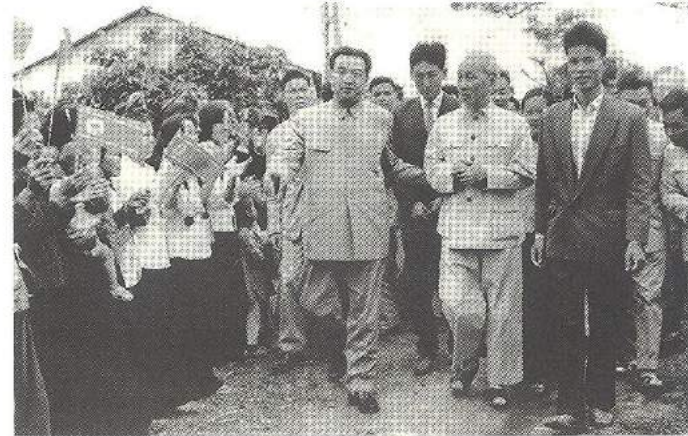
Chủ tịch Hồ Chí Minh và Thủ tướng Triều Tiên Kim Nhật Thành (bên trái) tại Hà Nội tháng 12/1958