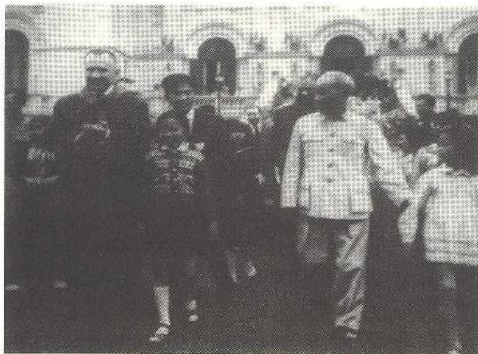
Chủ tịch Hồ Chí Minh và thiếu nhi Hà Nội đón khách quốc tế đến thăm Việt Nam, 1965