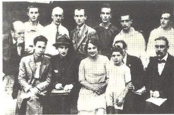
Đồng chí Nguyễn Ái Quốc (người ngồi đầu tiên từ trái sang) với một số đại biểu dự Đại hội lần thứ V Quốc tế Cộng sản tại Liên Xô, tháng 7/1924