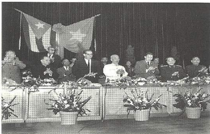
Chủ tịch Hồ Chí Minh chào mừng Tổng thống nước Cộng hòa Cu Ba Osvaldo Dorticós Torrado tại Thủ đô Hà Nội, ngày 23/10/1966