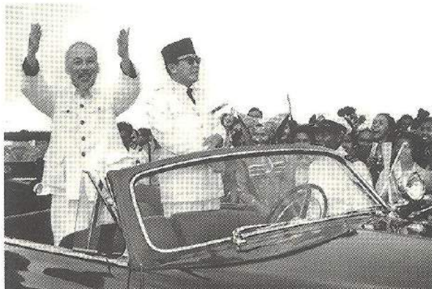
Chủ tịch Hồ Chí Minh thăm Indonesia, tháng 02/1959