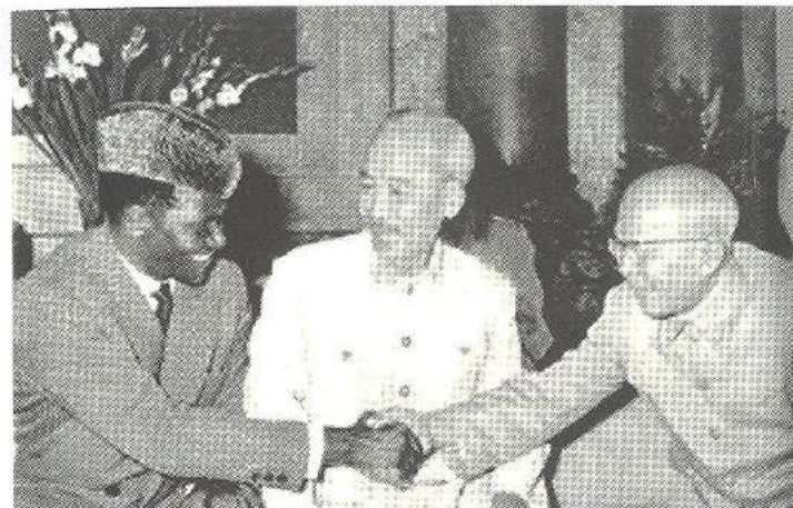
Chủ tịch Hồ Chí Minh và Phó Chủ tịch Tôn Đức Thắng tiếp Tổng thống nước Cộng hòa Ghinê (châu Phi), ngài Xêcu Turê sang thăm Việt Nam, năm 1960