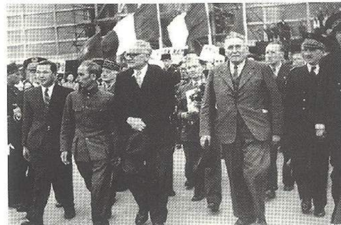
Bộ trưởng Bộ Hải ngoại Pháp Marius Moutet (đeo kính) đón Chủ tịch Hồ Chí Minh tại sân bay Le Bourget, ngày 22/6/1946