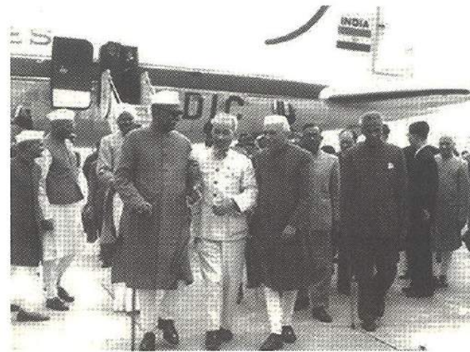
Tổng thống Rajendra Prasad và Thủ tướng J.Nehru đón Chủ tịch Hồ Chí Minh tại sân bay Palam, New Delhi trong chuyến thăm Ấn Độ, năm 1958