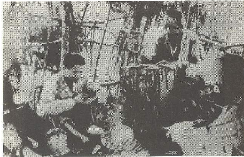
Chủ tịch Hồ Chí Minh theo dõi và chỉ đạo chiến dịch Biên giới 1950 ngay trên đường hành quân