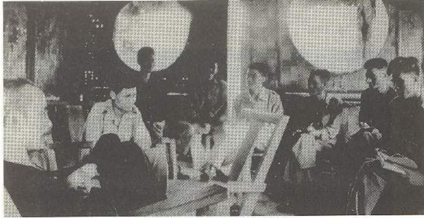
Chủ tịch Hồ Chí Minh thăm Tạp chí Cộng sản ở Việt Bắc trong kháng chiến chống Pháp