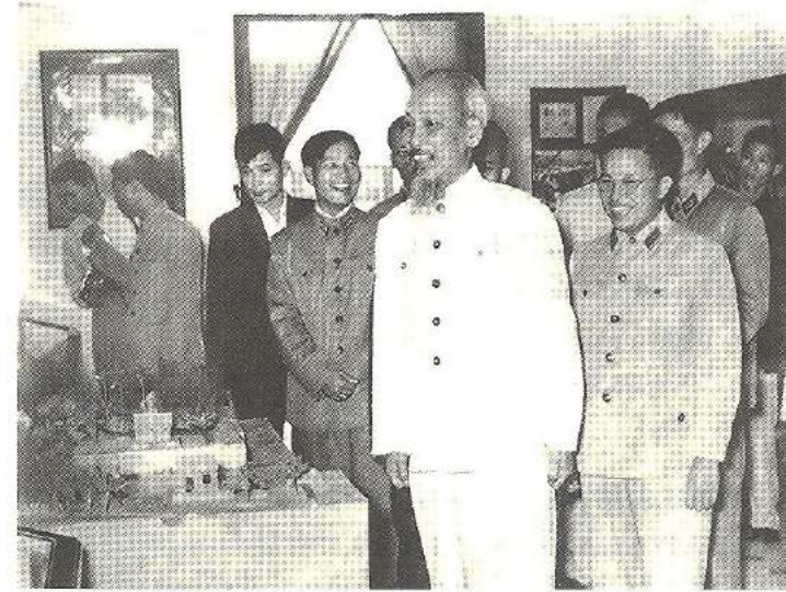
Chủ tịch Hồ Chí Minh thăm Bảo tàng Quân đội, năm 1959