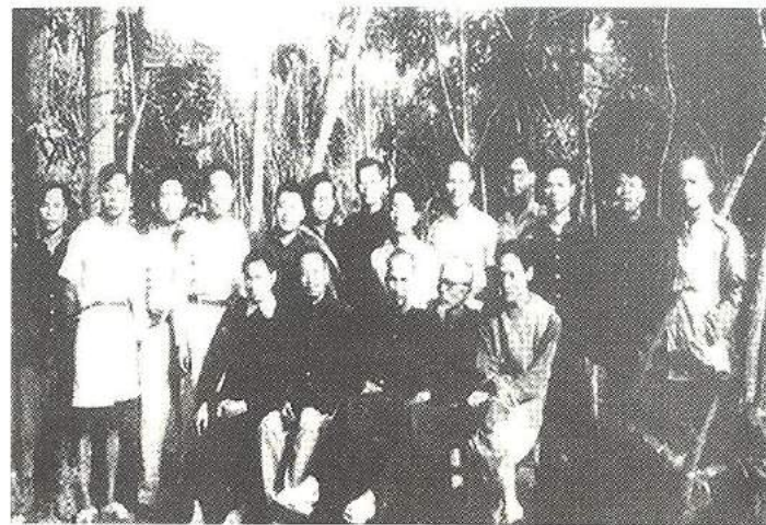
Hội đồng Chính phủ và Ban Thường trực Quốc hội họp ở Việt Bắc năm 1948. Hàng ngồi từ trái sang: Phạm Bá Trục, Hồ Tùng Mậu, Hồ Chí Minh, Tôn Đức Thắng, Hoàng Đạo Thúy