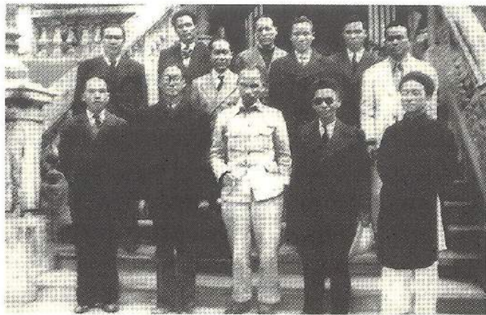
Chủ tịch Hồ Chí Minh với một số Bộ trưởng trong Chính phủ lâm thời nước Việt Nam Dân chủ Cộng hòa, năm 1945